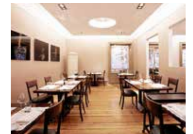
Cooler Design Das italienische Restaurant „Anna Sgroi“ in Hamburg