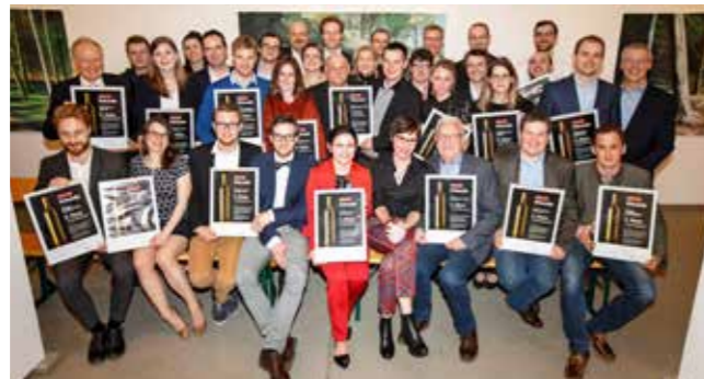
Ausgezeichnet Die Preisträger des FOCUS-Weintests in der Kunstkammer des Weinguts Dr. Hubert Burda. Im Hintergrund Bilder von Martin Sander