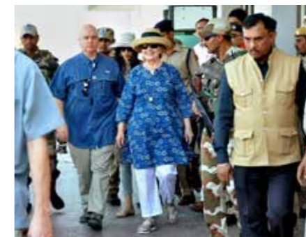
Leger Hillary Clinton bei ihrer Ankunft in Indien

H illary Clinton schießt weiter gegen Donald Trump. Auf einer Tagung im indischen Mumbai warnte die 70-Jäh-rige, man lebe in gefährlichen Zeiten. Trump habe „eine ziemliche Affinität zu Diktatoren“, er liebe deren autoritäre Art. Mit dem russischen Präsidenten Wladimir Putin sei es aber „mehr als das“.