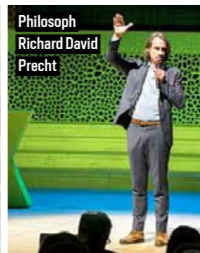
Philosoph Richard David Precht