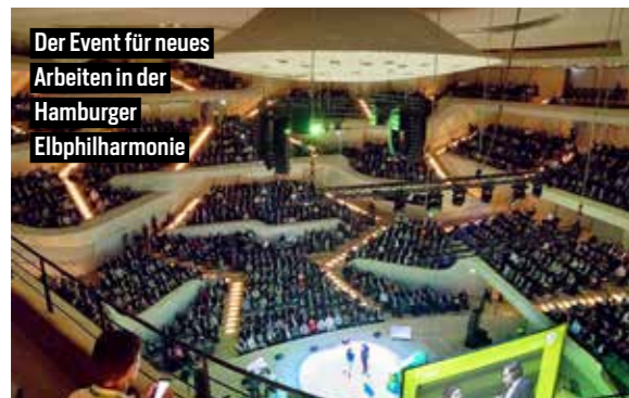
Der Event für neues Arbeiten in der Hamburger Elbphilharmonie