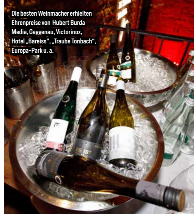
Die besten Weinmacher erhielten Ehrenpreise von Hubert Burda Media, Gaggenau, Victorinox, Hotel „Bareiss“, „Traube Tonbach“, Europa-Park u. a.