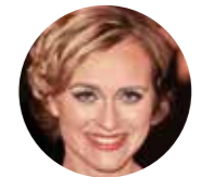
Caren Miosga Moderatorin